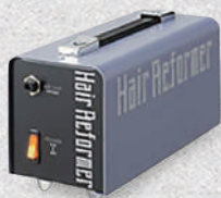
ヘアリフォーマー・スフィード